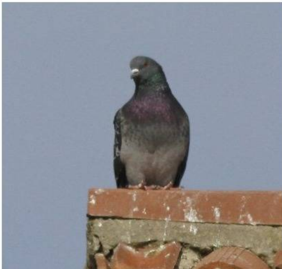
Foto con uccello grande nel fotogramma

Almeno 400 pixel di larghezza (massimo 1280 pixel)